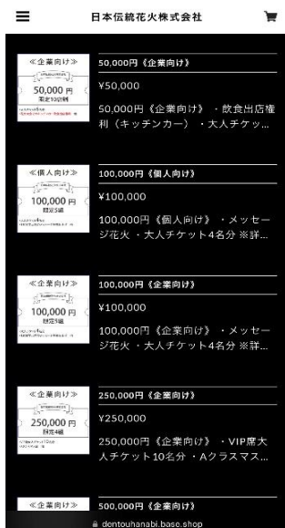
3. 50,000円〈企業向け〉を選択