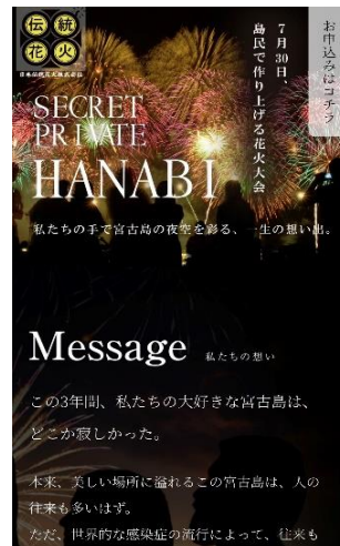
2.右上、お申し込みはコチラをクリック