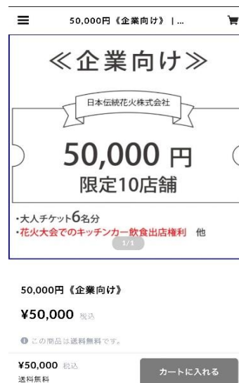
4.カートに入れて決済してください。